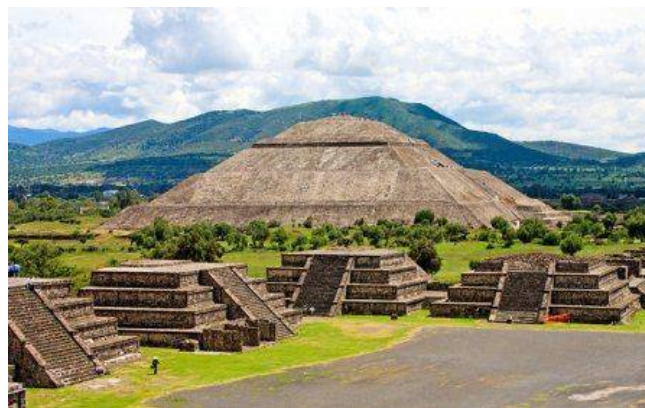
Restanten van Aztekenstad Teotihuacan (Dal van Mexico) met op de achtergrond de Piramide van de Zon