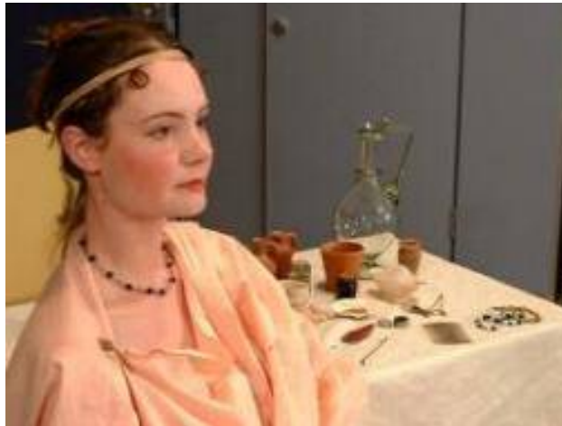
Make-up tafel van Romeinse vrouw