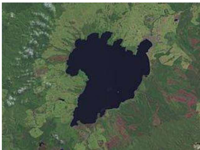
Taupomeer (Nieuw-Zeeland), 'litteken' van de in het jaar 181 ontplofte vulkaan Hatepe