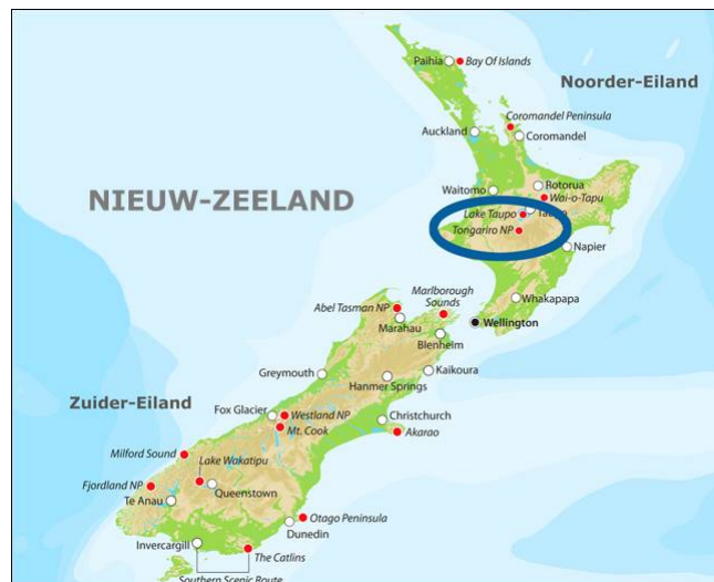
Binnen de blauwe elips ligt het Taupomeer