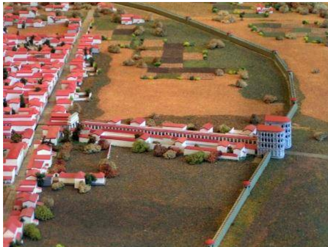
Trier in de Romeinse tijd met rechts de Porta Nigra