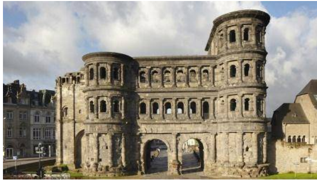
De Porta Nigra (stadspoort) van Trier (D) nu