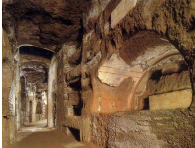
Catacomben in Rome