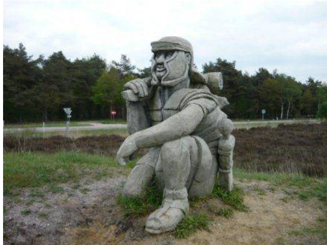
Standbeeld van Romeinse legionair op de locatie waar ooit een tijdelijk 'marskamp' werd gebouwd (heide Ermelo)

Deze en veel andere gebeurtenissen kom je tegen langs het Wereldtijdpad.