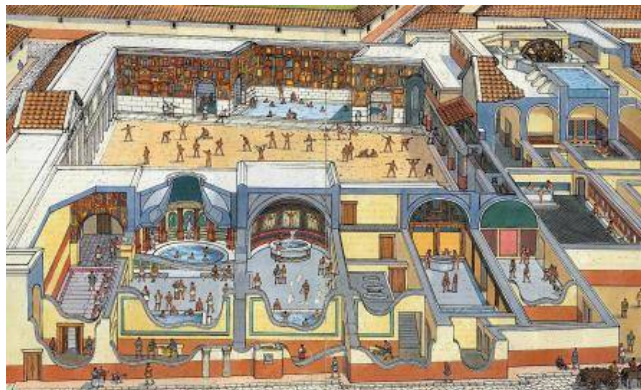
Gigantisch groot Romeins badhuis