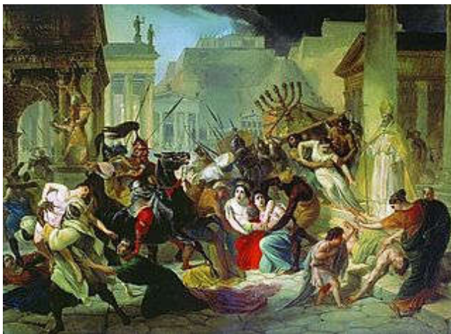
Barbaren plunderen Rome