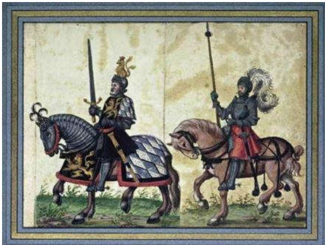
Stijgbeugel heeft invloed op de oorlogvoering

In de Middeleeuwen kun je er maar beter voor zorgen niet ziek te worden. Veel kinderen sterven in hun eerste levensjaar aan wat we nu 'onschuldige' ziekten noemen. Medische kennis komt niet boven het niveau van hocus-pocus. Dus als de 'zwarte dood' aan de deur klopt, zijn de rapen gaar.