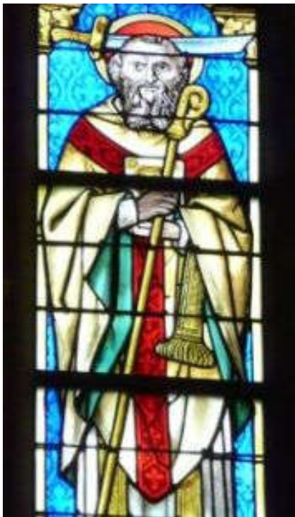
De heilige Theodardus van Maastricht