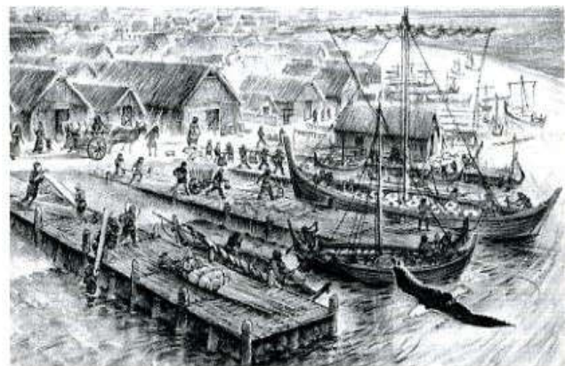
De haven van handelsplaatsje Dorestad