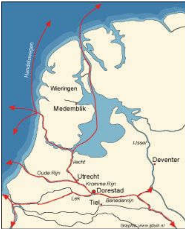
Dorestad lag op een strategische plek