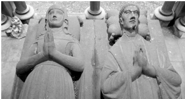
Grafmonument op begraafplaats Père Lachaise (Parijs)