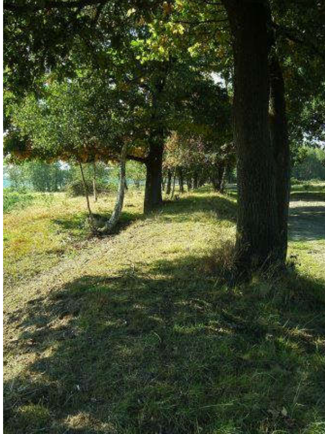
Restant van de landweer bij Holten