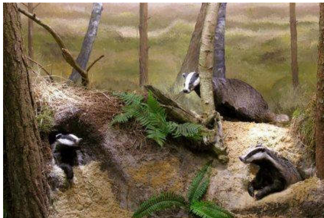
Natuurmuseum Holterberg: diorama dassenburcht