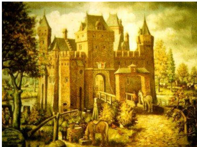
Kasteel De Waerdenborch, Holten

Ook het voormalige kasteel De Waerdenborch bij Holten speelde een rol bij de verdediging van het gebied.