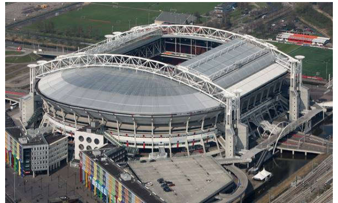
Johan Cruyff-arena Amsterdam

Tip! Beluister voor je op pad gaat de podcast bij deze rondwandeling. Dan krijg je in het kort te horen wat er in deze periode gaande is. Dat maakt het gemakkelijker om gebeurtenissen die je onderweg tegen komt in die tijd te plaatsen. De podcast staat op de website van het Wereldtijdpad: zie pagina van deze rondwandeling. Naar Podcast.