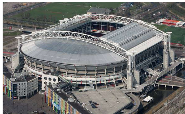
Johan Cruyff-arena Amsterdam