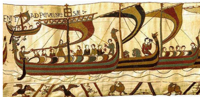
Vikingschepen landen in Normandië

Hoe komt het toch dat de Vikingen de Lage Landen voortaan links laten liggen?