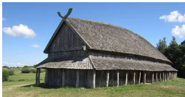
Woning/stal van Noormannen

Even een paar misverstanden de wereld uit. De meeste Noormannen zijn vreedzame boeren en handelaars die met hun familie en vee in dit soort boerderijen (zie onder) leven. Omdat de oudste zoon alles erft, zijn er andere zonen die hun geluk in het buitenland zoeken. Ze ontdekken dat je met afpersing en geweld sneller rijk kan worden dan met handel en bezorgen zo hun landgenoten een slechte naam. En verder... aan een Vikinghelm zijn geen hoorns bevestigd. Dat is later bedacht!