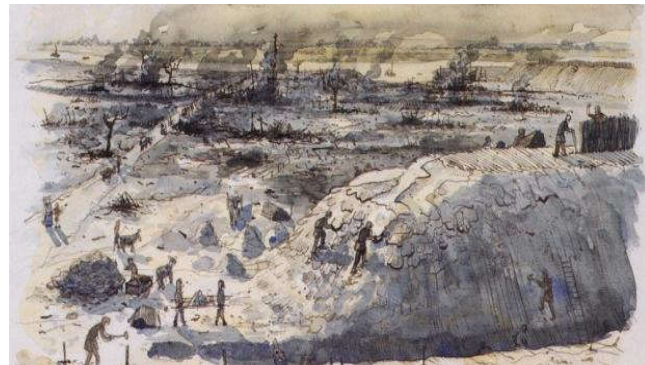
Deventer werpt een wal op tegen de Vikingen

Hij heet Karel de Dikke. Hij is de achterachterkleinzoon van Karel de Grote en is de baas in o.a. de Lage Landen. Althans dat probeert hij te zijn. Hij sluit daarvoor een deal met de vijand...! Maar of het helpt?