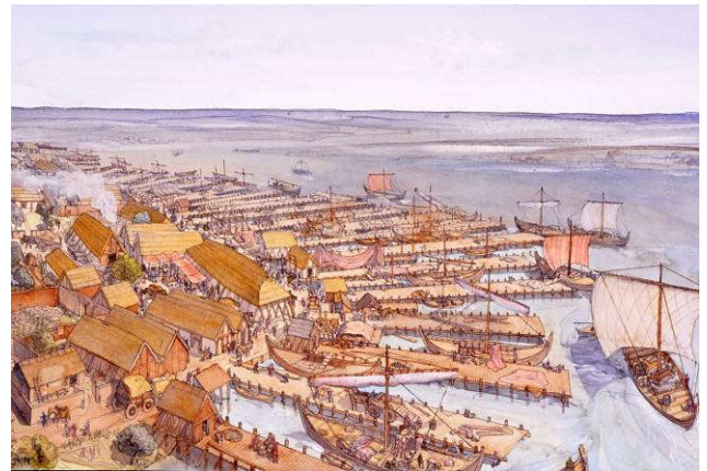
Dorestad, het 'Rotterdam' van rond 900