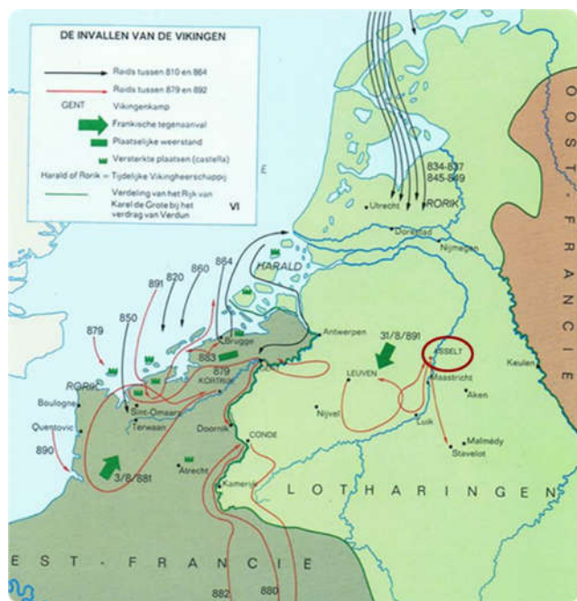
De pijlen geven aan waar de Vikingen invielen