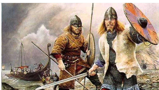
Avonturiers en vechtersbazen

Priesters en monniken zijn in deze tijd zo'n beetje de enigen die kunnen lezen en schrijven. Zij beschrijven hoe de Vikingen huis houden in kerken en kloosters. Daar hebben de Vikingen hun slechte imago aan te danken. Later onderzoek maakt duidelijk dat er ook Noormannen waren die hier gewoon handel kwamen drijven. Het is dus niet eerlijk om alle Scandinaviërs over één kam te scheren!