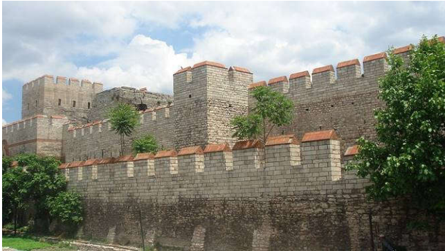
Nog steeds zijn de muren van het voormalige Constantinopel imposant

De Vikingen zijn bekwame zeelieden die met hun 'drakenschepen' (elk met tussen de 30 en 60 roeiers) via de Straat van Gibraltar de Middellandse Zee opvaren. Ontdek wat daar hun 'all inclusive' bestemmingen zijn.