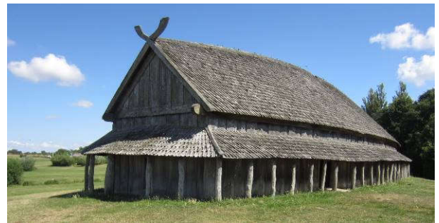
Woning/stal van Noormannen

Even een paar misverstanden de wereld uit. De meeste Noormannen zijn vreedzame boeren en handelaars die met hun familie en vee in dit soort boerderijen (zie onder) leven. Omdat de oudste zoon alles erft, zijn er andere zonen die hun geluk in het buitenland zoeken. Ze ontdekken dat je met afpersing en geweld sneller rijk kan worden dan met handel en bezorgen zo hun landgenoten een slechte naam. En verder... aan een Vikinghelm zijn geen hoorns bevestigd. Dat is later bedacht!