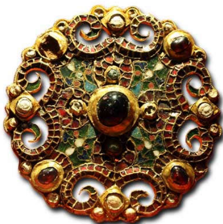
Gouden broche opgegraven in Wijk bij Duurstede. De broche werd in Frankrijk gemaakt.

Het West-Romeinse Rijk met hoofdstad Rome is in 476 al ten onder gegaan. Het Oost-Romeinse rijk met hoofdstad Constantinopel (het huidige Istanboel) is nog springlevend, maar niet onkwetsbaar. Lees het zelf.