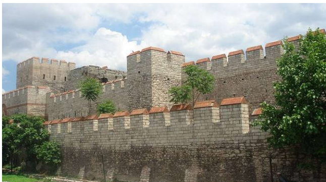
Nog steeds zijn de muren van het voormalige Constantinopel imposant

De Vikingen zijn bekwame zeelieden die met hun 'drakenschepen' (elk met tussen de 30 en 60 roeiers) via de Straat van Gibraltar de Middellandse Zee opvaren. Ontdek wat daar hun 'all inclusive' bestemmingen zijn.