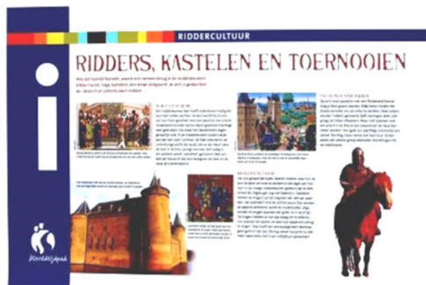
Naast 876: Langs het Wereldtijdpad staan 40 van dit soort draaipanelen met interessante informatie over een historisch thema.