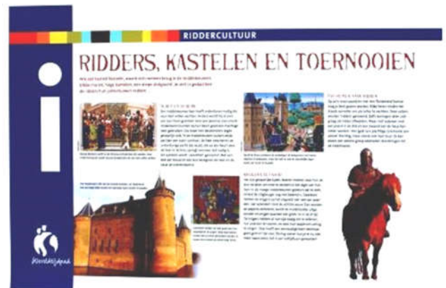
Naast 876: Langs het Wereldtijdpad staan 40 van dit soort draaipanelen met interessante informatie over een historisch thema.