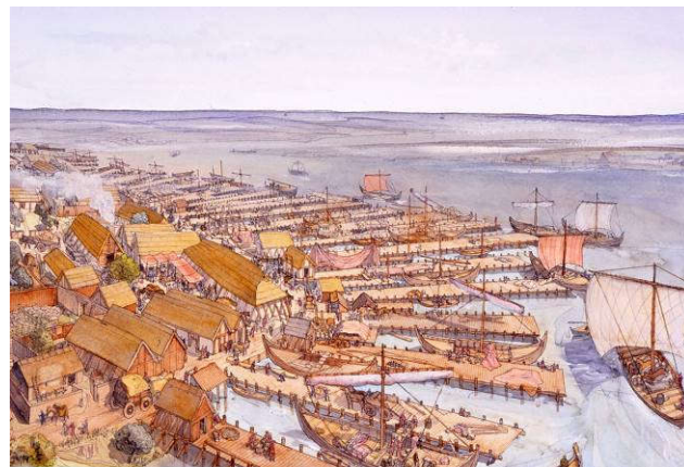
Dorestad, het 'Rotterdam' van rond 900