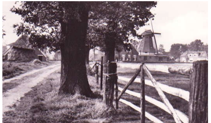
De Diekerhookse mölle

weefgetouwen opgesteld. Er is meer nieuws. Jamfabriek De Betuwe uit Tiel pakt de verkoop van zijn producten modern aan. De fabrikant bestelt negen handkarren om in grote steden jam op straat uit te venten. De prijs? Acht cent, mevrouw, voor één ons overheerlijke marmelade! Nederland rouwt om de dood van koning Willem III. Zijn tienjarige dochter Wilhelmina volgt hem op. Haar moeder Emma treedt voorlopig op als regentes. Uit het Franse Auvers-sur-Oise komt het bericht dat schilder Vincent van Gogh, 37 jaar oud, zelfmoord heeft gepleegd. En in Amerika besteden de kranten veel aandacht aan de eerste man die zijn leven op de elektrische stoel laat. (jaarpaal 1890, Wereldtijdpad).