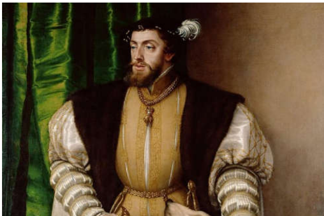
Karel V (1500-1558), koning van Spanje, Heer der Nederlanden en keizer van Duitsland