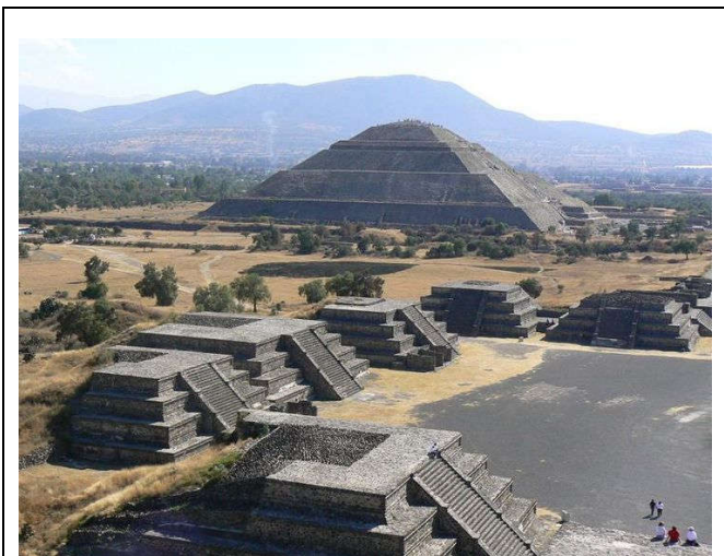
Pyramides van Teotihuacan (Mexico)