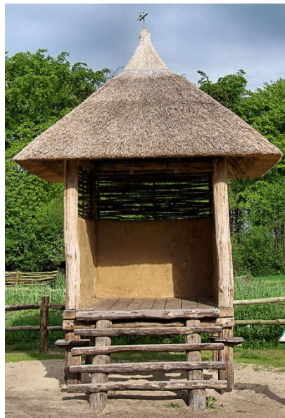
Reconstructie van een spieker uit de ijzertijd bij het Wekeromse Zand (Gld) - Wikipedia

Volgens deze schrijver heeft het meisje van Yde niet vaak de zon gezien. Hoe betrouwbaar is zo'n 'weerbericht'?