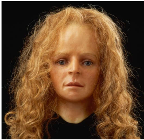
Reconstructie van het hoofd van het meisje van Yde – Assens Museum