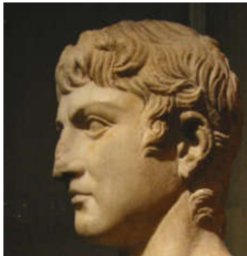
Germanicus (15 v. Chr. – 19) Populair Romeins generaal, opa van de latere keizer Nero

Nederland bestaat nog niet. De Rijn vormt de noordgrens van het Romeinse Rijk. Het meisje van Yde heeft waarschijnlijk nooit een Romein gezien. Mogelijk heeft ze er wel over gehoord. Gevaarlijker zijn de wolven, oerossen, beren en elanden die haar omgeving onveilig maken.