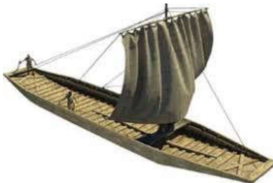
Romeins vrachtschip - Archeon

Het meisje van Yde komt uit een familie van keuterboertjes die met moeite het hoofd boven water houden. Maar op nog geen 250 kilometer naar het zuiden is landbouw booming business. Hoe is dat te verklaren?