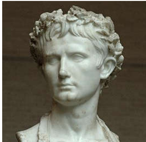
Gaius Octavius, alias keizer Augustus (63 voor Chr. – 14) - Wikipedia

Yde is een dorpje boven Assen. In 1897 ontdekten een paar turfstekers er in een veengebied de restanten van een meisje dat daar kennelijk al heel lang ligt. En dat klopt. Het 'meisje van Yde' leefde rond het begin van onze jaartelling. Wat is er met haar gebeurd? Hoe zag haar wereld er uit? We gaan op pad om daar achter te komen.