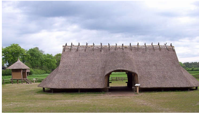
Boerderij uit IJzertijd – Wikipedia