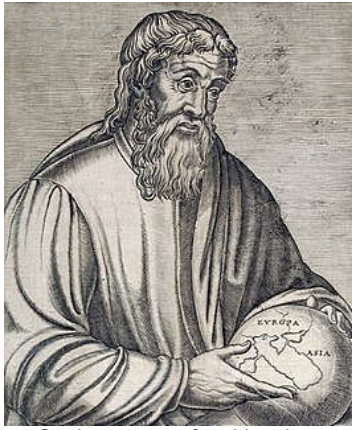
Strabo, geograaf en historicus (ca. 63 v.Chr. – ca.24) Wikipedia