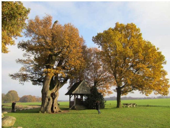
De Kroezeboom in Fleringen (Oost-Twente) is tussen de 400 en 500 jaar oud - Wikipedia

In Zuid-Nederland (dat was toen onderdeel van de Romeinse provincie Neder-Germanië) komt in de tijd waarin het meisje van Yde leefde, de handel op gang. Ook de slavenhandel. In Noord-Nederland kom je alleen rondtrekkende handelaren (marskramers) tegen.