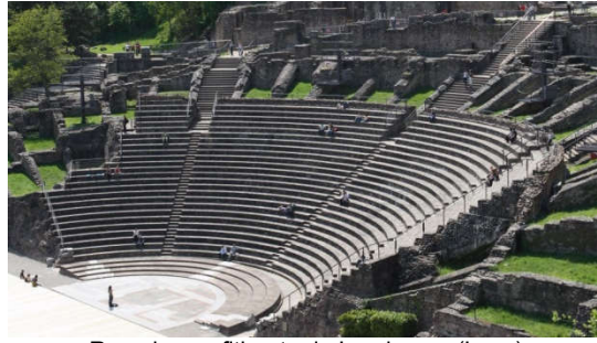
Romeins amfitheater in Lugdunum (Lyon)

ten noorden ervan moet de Romeinse legerleiding letterlijk alle zeilen bijzetten om de legionairs van voedsel te voorzien.