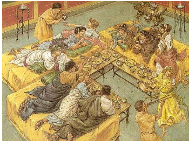
Romeins tafelen - Skynet