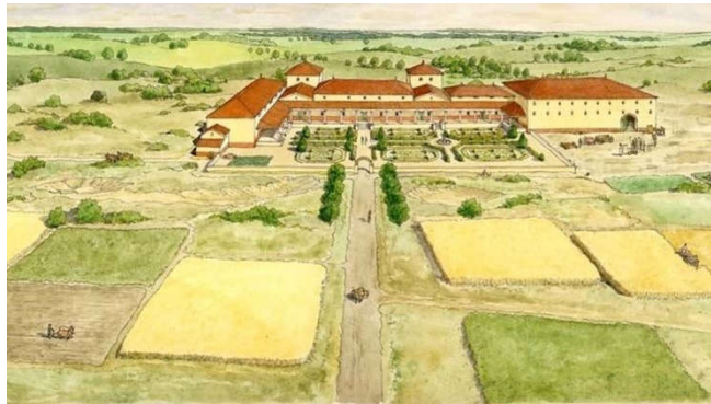
In Limburg worden steeds meer Romeinse villa's gebouwd

Het meisje van Yde kent alleen haar eigen directe omgeving. Zij en haar familie zijn honkvast en gaan niet ver van huis. Zou het land van de Friezen haar net zo hebben verbaasd als Plinius?