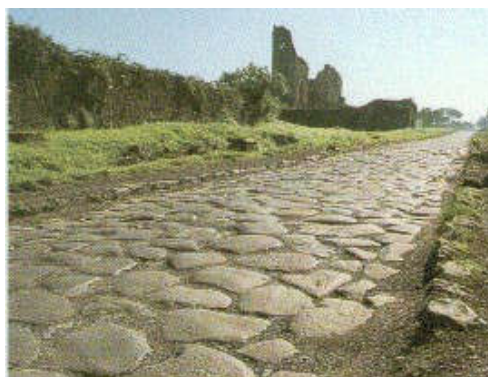
Weg uit Romeinse tijd

Het meisje leeft in de ijzertijd. Waarom heeft haar vader liever voorwerpen van ijzer dan van brons?