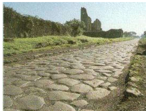
Weg uit Romeinse tijd

Het meisje leeft in de ijzertijd. Waarom heeft haar vader liever voorwerpen van ijzer dan van brons?