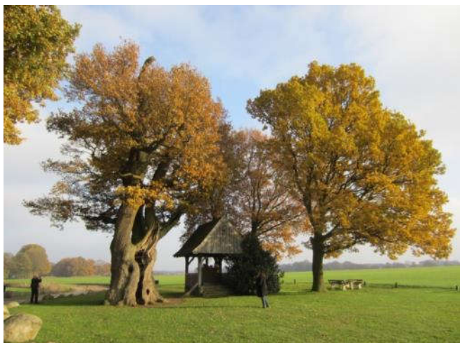
De Kroezeboom in Fleringen (Oost-Twente) is tussen de 400 en 500 jaar oud - Wikipedia

In Zuid-Nederland (dat was toen onderdeel van de Romeinse provincie Neder-Germanië) komt in de tijd waarin het meisje van Yde leefde, de handel op gang. Ook de slavenhandel. In Noord-Nederland kom je alleen rondtrekkende handelaren (marskramers) tegen.