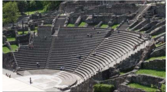
Romeins amfitheater in Lugdunum (Lyon)

In Zuid-Limburg wordt in deze tijd meer dan voldoende voedsel geproduceerd, maar in het gebied ten noorden ervan moet de Romeinse legerleiding letterlijk alle zeilen bijzetten om de legionairs van voedsel te voorzien.