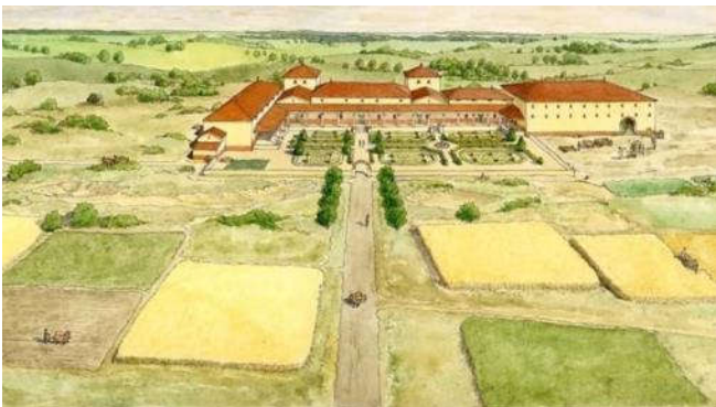
In Limburg worden steeds meer Romeinse villa's gebouwd

Het meisje van Yde kent alleen haar eigen directe omgeving. Zij en haar familie zijn honkvast en gaan niet ver van huis. Zou het land van de Friezen haar net zo hebben verbaasd als Plinius?