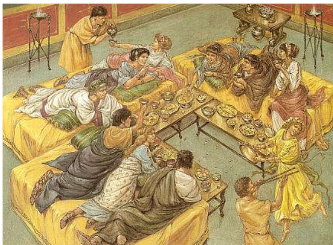
Romeins tafelen - Skynet