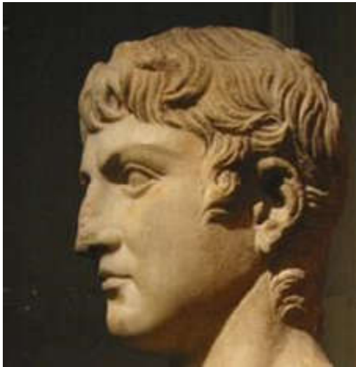
Germanicus (15 v. Chr. – 19) Populair Romeins generaal, opa van de latere keizer Nero

Nederland bestaat nog niet. De Rijn vormt de noordgrens van het Romeinse Rijk. Het meisje van Yde heeft waarschijnlijk nooit een Romein gezien. Mogelijk heeft ze er wel over gehoord. Gevaarlijker zijn de wolven, oerossen, beren en elanden die haar omgeving onveilig maken.