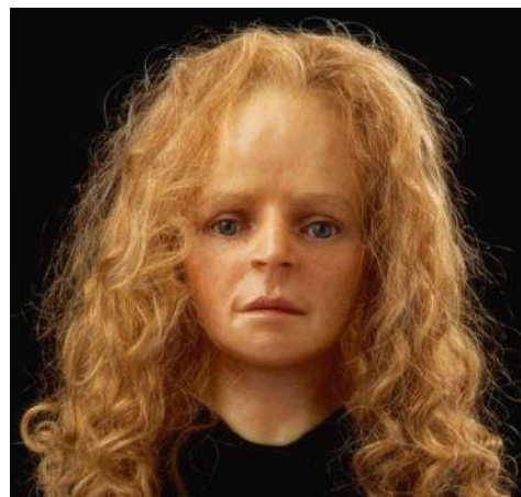
Reconstructie van het hoofd van het meisje van Yde – Assens Museum

Tip! Beluister voor je op pad gaat de podcast bij deze rondwandeling. Dan krijg je in het kort te horen wat er in deze periode gaande was. Dat maakt het gemakkelijker om gebeurtenissen die je onderweg tegen komt in die tijd te plaatsen. De podcast staat op de website van het Wereldtijdpad: zie de pagina van deze rondwandeling.