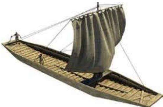
Romeins vrachtschip - Archeon

Het meisje van Yde komt uit een familie van keuterboertjes die met moeite het hoofd boven water houden. Maar op nog geen 250 kilometer naar het zuiden is landbouw booming business. Hoe is dat te verklaren?