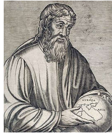
Strabo, geograaf en historicus (ca. 63 v.Chr. – ca.24)

Kranten, tv, sociale media...? Internationaal Strafhof? De Romeinen kunnen hier ongestraft hun gang gaan. Wordt het langzamerhand geen tijd dat de Italianen excuses maken voor de oorlogsmisdaden die de Romeinen in die tijd hebben begaan?