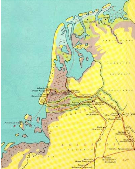
'Nederland' in die tijd. Zoek de verschillen!