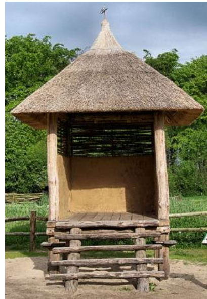
Reconstructie van een spieker uit de ijzertijd bij het Wekeromse Zand (Gld) - Wikipedia

Volgens deze schrijver heeft het meisje van Yde niet vaak de zon gezien. Hoe betrouwbaar is zo'n 'weerbericht'?