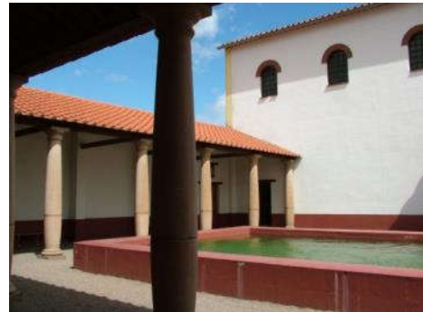
Romeins badhuis - Archeon