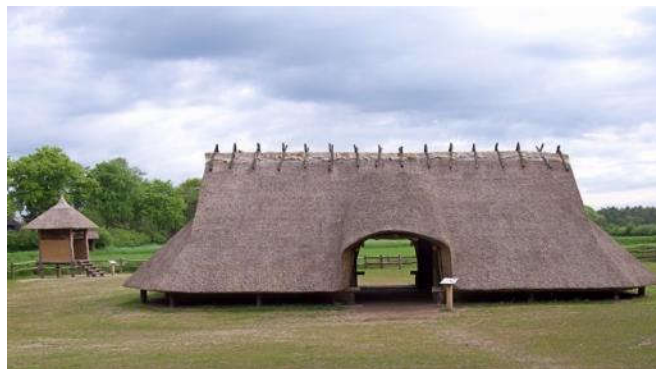
Boerderij uit IJzertijd