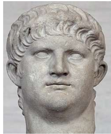
Keizer Nero, 54-68

Er wordt gefluisterd dat de keizer er achter zit. Complottheorieën zijn van alle tijden. Daar heb je geen sociale media voor nodig.