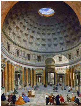
Giovanni Paolo Pannini (1691-1765)

Jaarpaal 105, kubuszijden W1 en W2 De ontdekking van de Chinees Cai Lun heeft de wereld veranderd. Hoe?