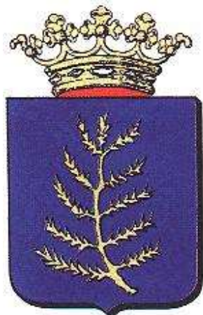
Stadswapen van Rijssen.

Graaf Otto III was bisschop van Utrecht. Hij verleende op 5 mei 1243 stadsrechten aan Rijssen. Daarmee bezorgde hij zichzelf, als hij van Utrecht naar bijvoorbeeld Oldenzaal reisde, een veilige verblijfplaats. Rijssen was in die tijd omringd door moerassen.