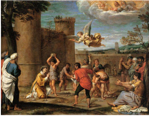
Steniging van Stefanus (Annibale Carracci / 1560-1609)