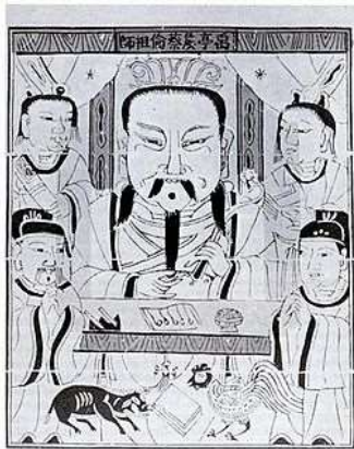
Cai Lun

Meer dan 1000 jaar later (5 mei 1243) verleende de Utrechtse bisschop Otto III Rijssen dezelfde eer. Zo iets gebeurt nu niet meer. Is dat jammer?