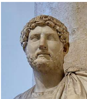
Keizer Hadrianus (117-138) Afbeelding Wikipedia

Jaarpaal 119, kubuszijden E1 en E2 Een dergelijk eerbetoon is in de huidige wereld ondenkbaar. Hoe zit dat?