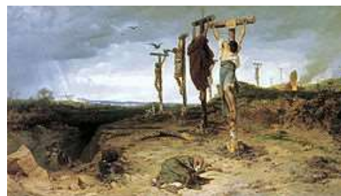
Gekruisigde slaven in het oude Rome (Fyodor Bronnikov, 1878)

Een van de ergste in zijn soort! Hoe zouden we daar nu op reageren?