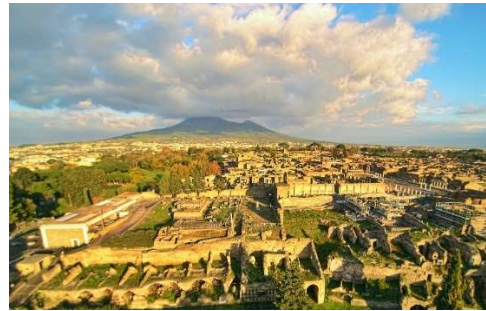
Pompeï met Vesuvius (afbeelding Wikipedia)

Ook dat is van alle tijden. Ongetwijfeld ken je nog zo'n voorbeeld van een machthebber die recent ondanks zijn verlies de overwinning claimde?