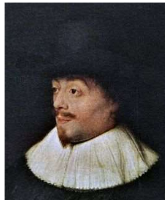
(Portret door Jan Lievens (1627-1630).

Vernoemd naar Constantijn Huygens (1596-1687) , een van onze grootste dichters uit de Gouden Eeuw, diplomaat, secretaris van o.a. Frederik Hendrik, geleerde, componist, architect en talenwonder. Met andere woorden: een alleskunner. Vader van staatsman en natuurkundige Constantijn Huygens jr. en van de geniale natuur- en wiskundige Christiaan Huygens. Naamgever van de Constantijn Huygensprijs voor literatuur.