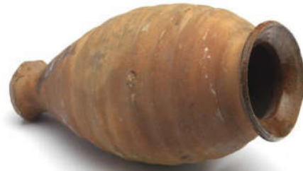
Wijnamfoor (Museum Boijmans)

We weten niet precies hoe het was om vrouw te zijn in Dorestad. In China hadden ze daar in elk geval uitgesproken ideeën over (zie 694-W ). Waar kom je die opvattingen vandaag de dag nog tegen?