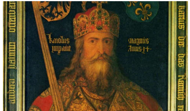
Karel de Grote (742 of 743 – 814)