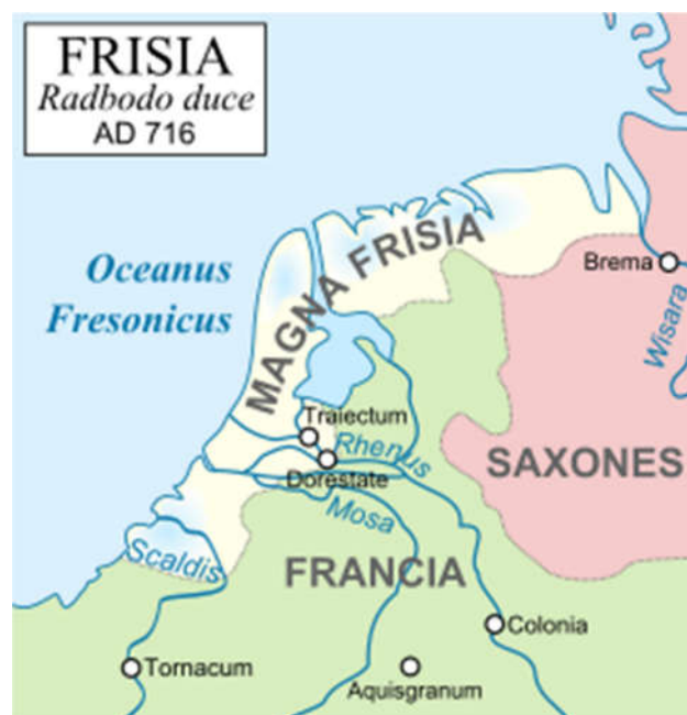
De inwoners van Dorestad zijn Friezen (Wikipedia)

het Rotterdam van nu. Dorestad was namelijk de grootste havenstad van noordwest Europa: veel handel en internationaal georiënteerd. Okay, Dorestad telde maar een paar duizend inwoners, maar vergeleken met Utrecht (400 inwoners) en Amsterdam (moerasgebied) alleszins respectabel voor die tijd.