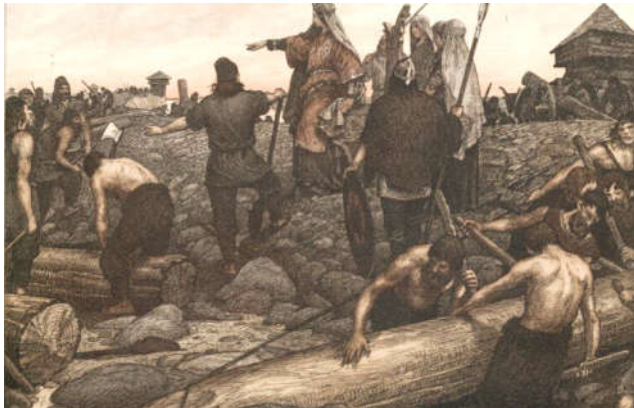
Slavenhandel van de Vikingen (Historiek)

En je kunt er ook op schaatsen! Wat is jouw mooiste schaatsherinnering?