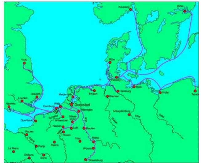
De blauwe lijnen zijn handelsroutes van en naar Dorestad (Dorestad onthuld)

Ook zo benieuwd naar hoe het was om in Dorestad te wonen? Luister dan naar de podcast Baldo van Dorestad (zie pagina De Overtoom op wereltijdpad.nl).