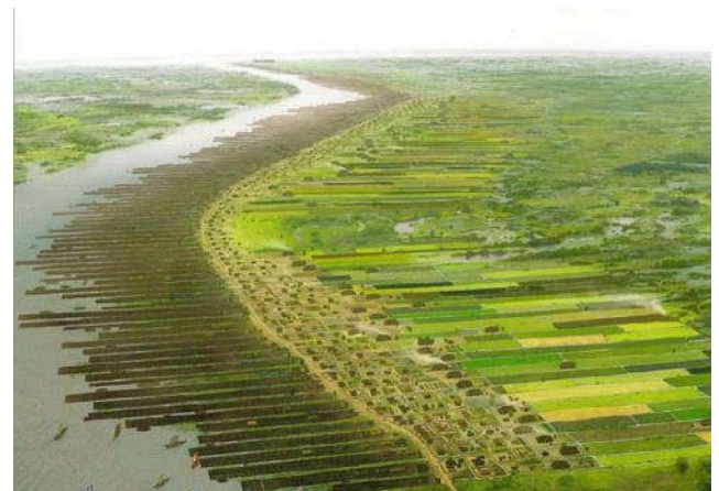
Aanlegsteigers langs de oever van de Kromme Rijn

Waaruit is uit op te maken dat Dorestad enige allure had?