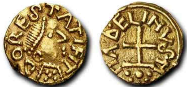
DORESTAT FIT = in Dorestad geslagen (Dorestad onthuld)

De handel kende ook in deze tijd geen grenzen! Een jaar later trekken de Friezen zich uit Dorestad terug. Hoe kwam dat zo? (zie voor een antwoord 689-N1)