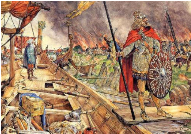
De Noormannen voor Dorestad'. Schoolplaat van J.H. Isings (1927)