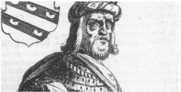
Radboud, koning der Friezen (679-719)

Het verhaal gaat dat Karel ook Dorestad heeft bezocht. De koning had geen vaste woon- of verblijfplaats, maar reisde van palts (koninklijke residentie, bijv. Valkhof Nijmegen) naar palts. Waarom vestigde Karel zich niet op één plek?