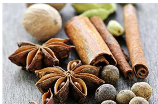
Oosterse kruiden (Bridgewaterwebshop)

Tijdens het eerste deel van de wandeling wordt bij vrij veel jaarpaaltjes even stil gestaan. Maar na jaar 700 loop je met zevenmijlslaarzen door de geschiedenis.