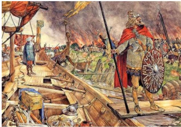
De Noormannen voor Dorestad'. Schoolplaat van J.H. Isings (1927)