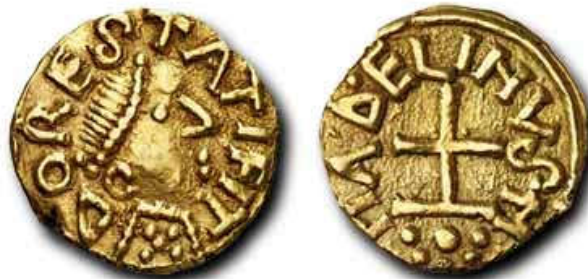
DORESTAT FIT = in Dorestad geslagen (Dorestad onthuld)

De handel kende ook in deze tijd geen grenzen! Een jaar later trekken de Friezen zich uit Dorestad terug. Hoe kwam dat zo? (zie voor een antwoord 689-N1 )