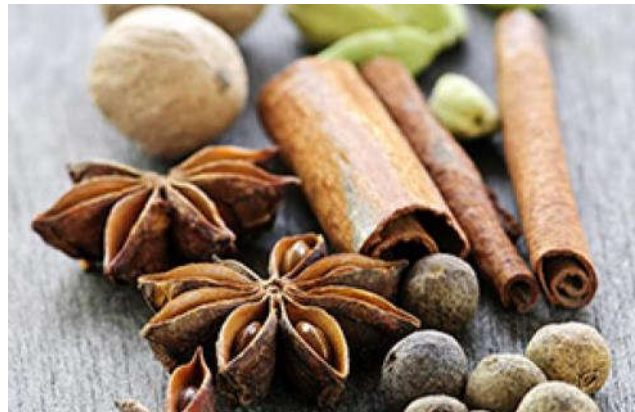
Oosterse kruiden (Bridgewaterwebshop)

Tijdens het eerste deel van de wandeling wordt bij vrij veel jaarpaaltjes even stil gestaan. Maar na jaar 700 loop je met zevenmijlslaarzen door de geschiedenis.