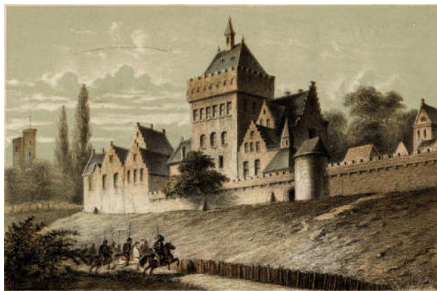
Valkhof – Nijmegen (Atlassenkaart)

Ooit kwamen Scandinavische handelaren naar Dorestad om handel te drijven. Nu vooral om te plunderen. Hoe zou dat komen?