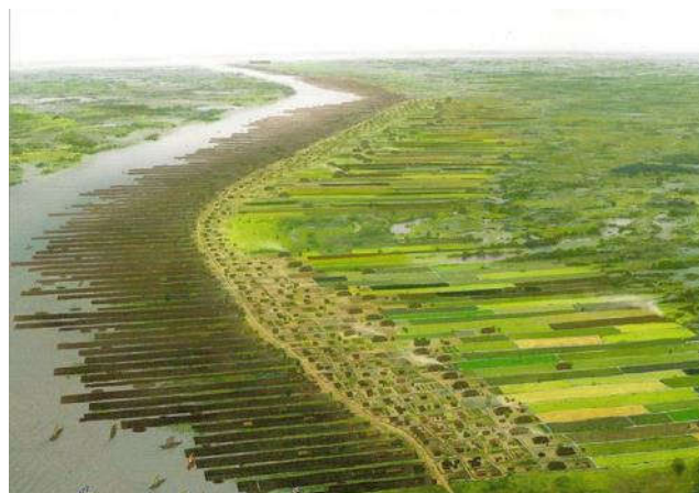
Aanlegsteigers langs de oever van de Kromme Rijn

Waaruit is uit op te maken dat Dorestad enige allure had?