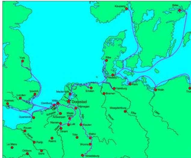
De blauwe lijnen zijn handelsroutes van en naar Dorestad (Dorestad onthuld)

Ook zo benieuwd naar hoe het was om in Dorestad te wonen? Luister dan naar de podcast Baldo van Dorestad (zie pagina De Overtoom op wereldtijdpad.nl).