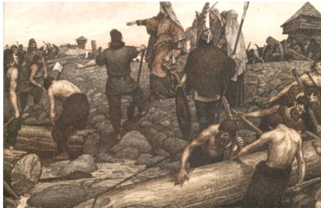
Slavenhandel van de Vikingen (Historiek)