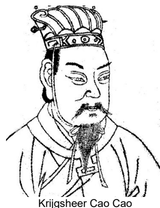
Krijgshere Cao Cao

Van het centrale gezag van de Han-keizers is weinig meer over. Daardoor zijn reizigers hun geld en leven niet meer zeker.