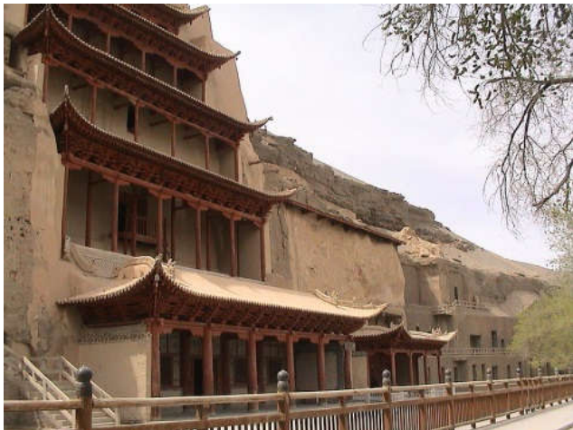
De Mogao-grotten in Dunhuang staan tegenwoordig op de Werelderfgoedlijst van de UNESCO.