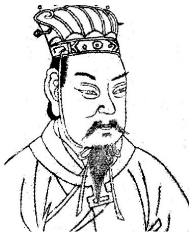
Krijgsheer Cao Cao

Van het centrale gezag van de Han-keizers is weinig meer over. Daardoor zijn reizigers hun geld en leven niet meer zeker.