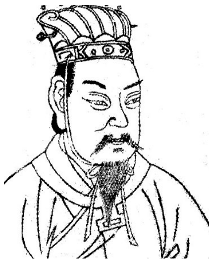
Krijgsheer Cao Cao

Van het centrale gezag van de Han-keizers is weinig meer over. Daardoor zijn reizigers hun geld en leven niet meer zeker.