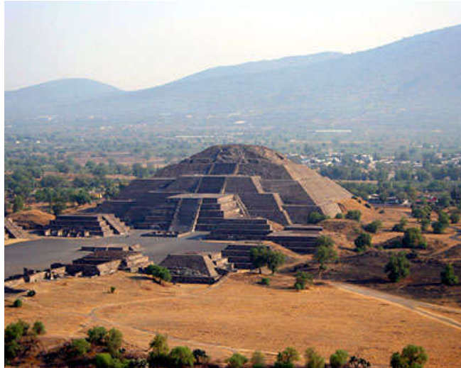
Piramide van de Zon in Teotihuacán (Mexico)

Aan de macht van de keizerlijke Han-familie die vier eeuwen achtereen China regeerde, lijkt een einde te komen.