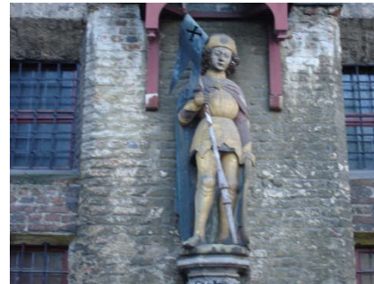
Standbeeld van Victor voor de Dom van Xanten