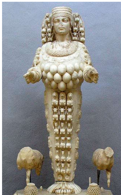
Artemis, godin van de vruchtbaarheid

De kerkvader heeft een gigantisch klus geklaard.