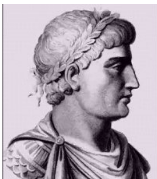
Keizer Theodosius (346-395)

En wat doe je als de inhoud van boeken je niet bevalt?