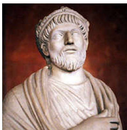
Keizer Julianus II (331-363)

Keizer Constantius II neemt een opmerkelijk besluit.