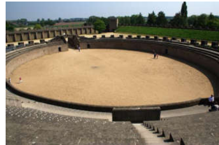
Amfitheater van Xanten

Christenen zijn hun leven vaak niet zeker, omdat ze weigeren offers aan de keizer te brengen. Maarf dankzij de nieuwe keizer zijn christenen officieel niet meer vogelvrij.