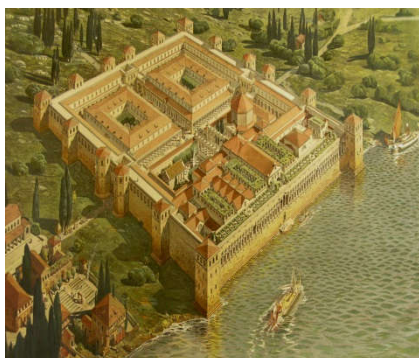
Paleis van Diocletianus in Split (Kroatië)

Onder keizer Diocletianus en medekeizer Galerius krijgen christenen het zwaar te verduren.