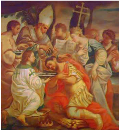
Gregorius doopt koning Tiridates