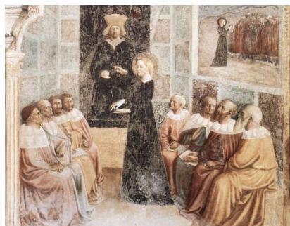
Hypatia van Alexandrië in gesprek met filosofen