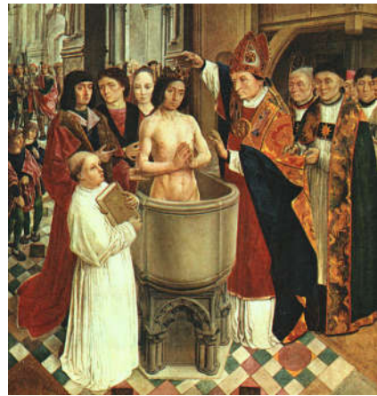
Doop van Clovis I (465-511)

Paus Gelasius heeft in alle bescheidenheid (!) iets bedacht wat hem belangrijker maakt dan de keizer.