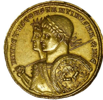
Keizer Constantijn samen met de zonnegod op één munt.